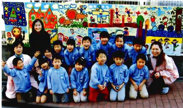
平成25年度卒園記念制作 壁画「たのしいあそび」