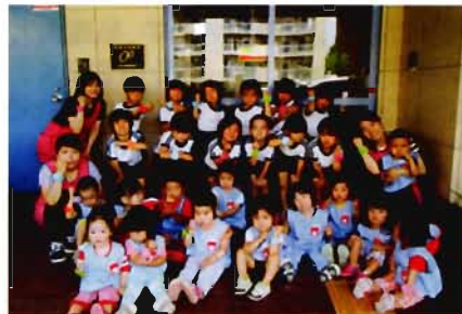
5 歳 児 と 2 歳 児