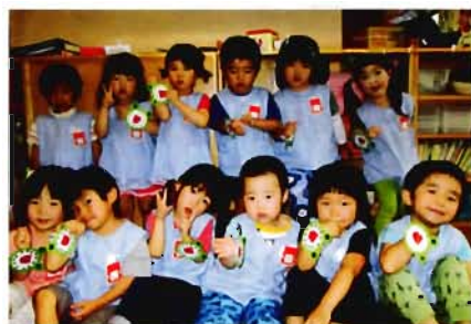
3 歳 児

生活の流れが違う乳児と幼児ではなかなか関わりを持つ事が難しいのが現状ですが、今回のような関わりが日頃から持てるように、子ども達と相談しながら実践して行きたいと思っています。