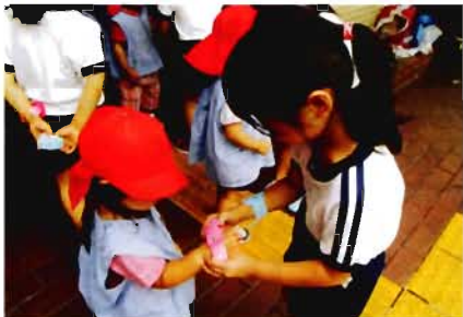
5 歳 児（2 歳 児 と の 交 流）