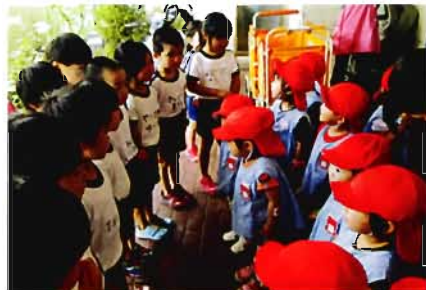
5 歳 児（2 歳 児 と の 交 流）