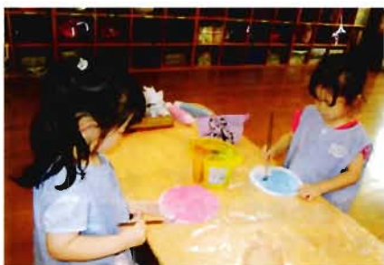
4 歳 児 製 作